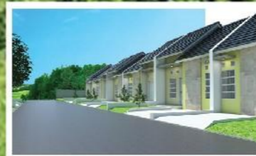
Area Pengembangan Tahap Selanjutnya