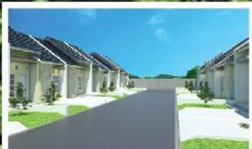
Area Pengembangan Tahap Selanjutnya